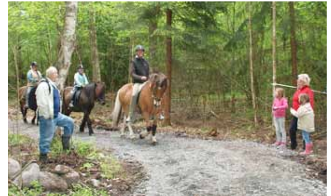
Fortamarksslingan är både promenad- och ridstig. Tänk på att visa hänsyn till varandra.

utmed Norra Hagenvägen. På vänster sida har du Gräppås golfbana och på höger är det vall och hästhagar. Dikesrenarna i denna del av Onsala är artrika. Känner du igen några växter?